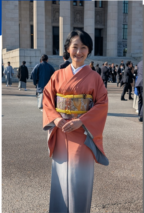
1月24日 通常国会召集日